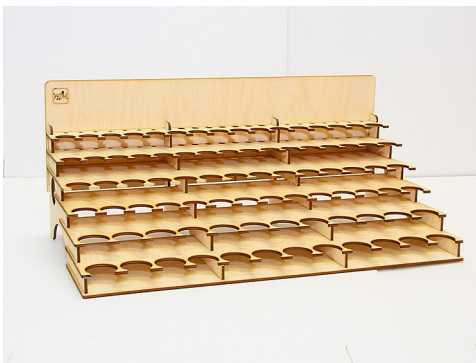
Вид готового изделия.